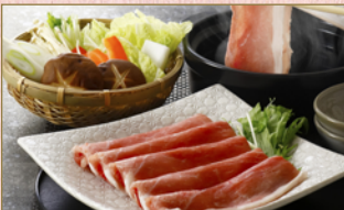
3212-039 九州産三元豚しゃぶしゃぶ肉