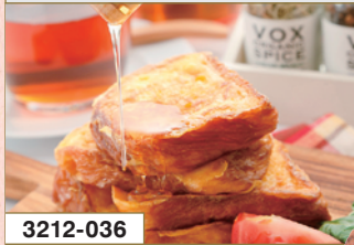
3212-036 ボロニーヤ ジュニア2本セット