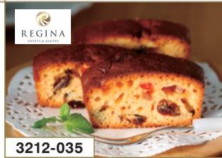
3212-035 REGINA フルーツケーキ