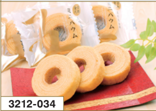
3212-034 五郎島金時 ミニバウムクーヘン11個入