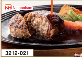
3212-021 極み焼® ハンバーグステーキ3種セット

内容量:デミグラスソース225g×1・和風おろしソース225g×1・ 4種チーズ225g×1 / 賞味期間:31日(冷蔵)