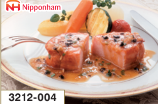
3212-004 日本ハム 本格派ギフト

内容量:あらびきミートローフ150g・たれ漬け焼豚180g・ 特撰あらびきウインナー70g / 賞味期間:50日(冷蔵)