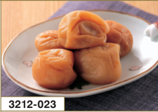
3212-023 紀州産南高梅 はちみつ梅干し