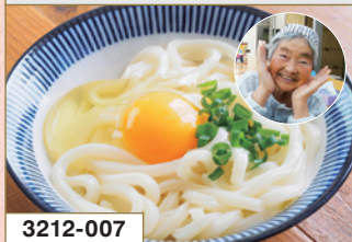
3212-007 池上製麺所 釜たま讃岐うどん 9食入