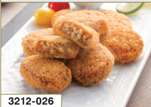
3212-026 宮崎県産 三元豚メンチカツ