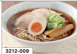
3212-009 飛騨高山ラーメン「角や」 中華そば 8食入