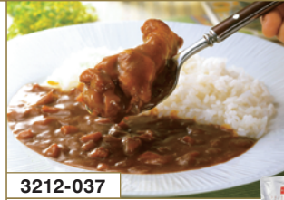
3212-037 博多華味鳥 手羽元カレー4食入