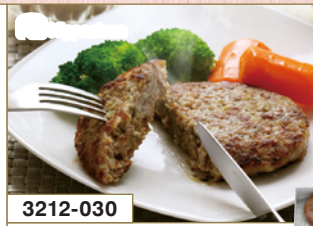
3212-030 国産牛の 生ハンバーグ4個入